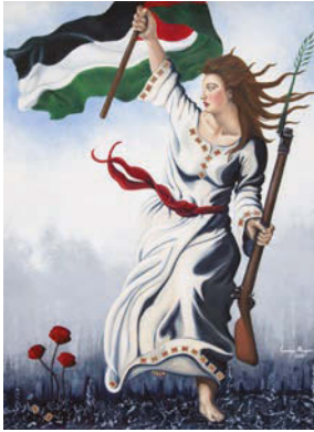
4. 90/120 cm, Oil on canvas 2017