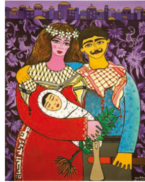
8. 80/120 Acrylic on canvas 2017