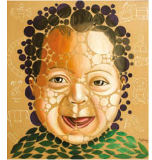
10. 100/90 Oil painting on mag- nets and iron, 2017