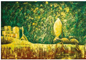
5. 115/63 Acrylic on canvas 2017