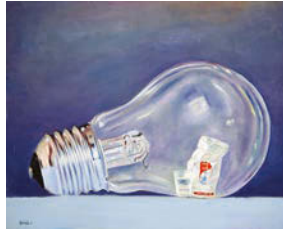
6. 100/80 Oil on canvas 2017