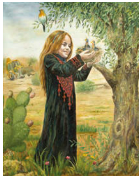
7. 160/90 cm, Oil on canvas 2017