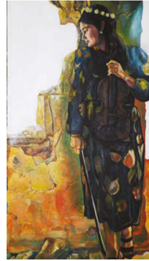
3. 160/90 cm, Acrylic on canvas 2017