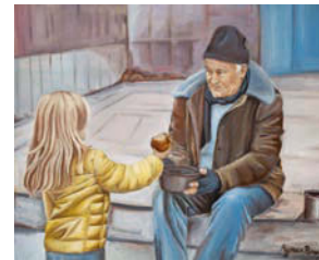
9. 100/80 Oil on canvas 2017