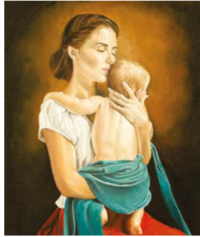
2. 80/60 cm, Oil on canvas 2016