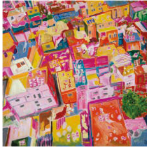
1. 100/100 cm, Acrylic on canvas 2016