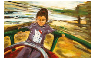
11. 90/60 acrylic on canvas 2017